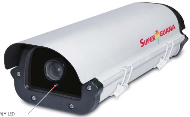
카메라 헬스 체크 LED