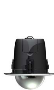
천장 매립형 (WIHI-UE20D)