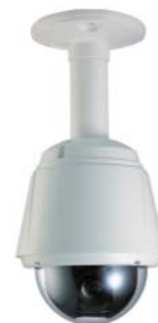
천장 부착형 (WIHO-UE20D)