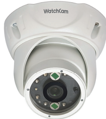
· 감지 거리