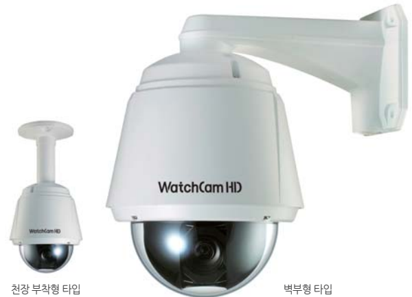
천장 부착형 타입