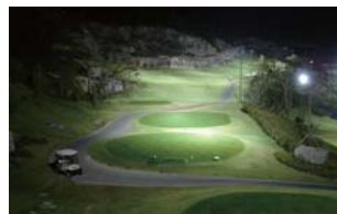
[ 다크 이구아나 카메라 ]