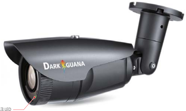
카메라 헬스 체크 LED