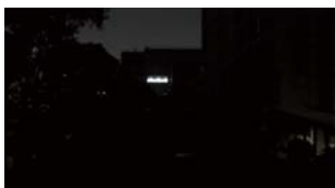
[ 일반 저조도 ]