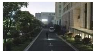
[ 초저조도 야간칼라 ]