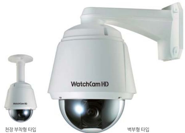
전장 부착형 타입