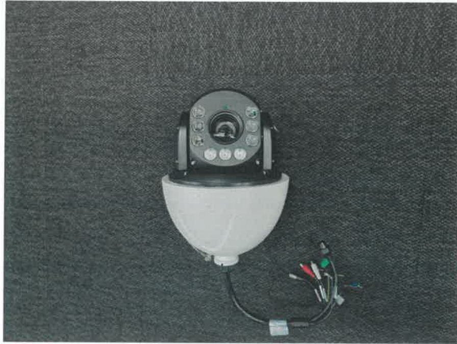
< 사진.1 정면 >

본 시험성적서의 진위확인용 DocuQR 홈페이지 및 애플리케이션에서 가능합니다.