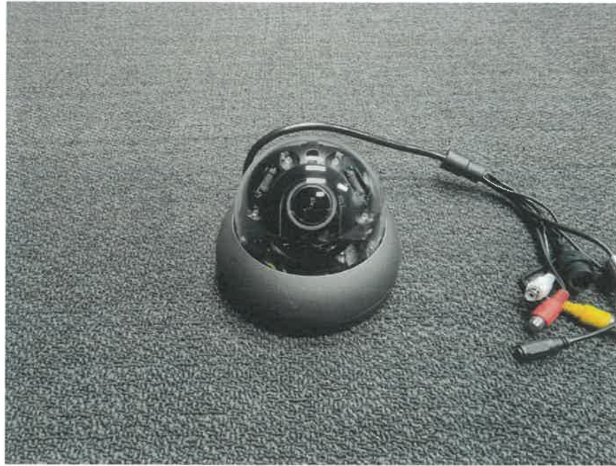
< 사진.1 정면 >

본 시험성적서의 진위확인은 DocuQR 홈페이지 및 애플리케이션에서 가능합니다.